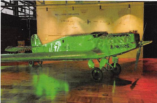
Das Flugzeug Bremen D-1167 in der Bremenhalle wurde 2020 im Rahmen des Global Greening Project grün beleuchtet.