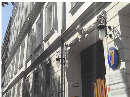
Der Eingang zum Gebäude der Botschaft von Irland, Jägerstraße 51, 10117 Berlin