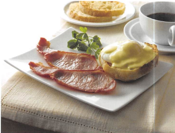
Irische Eier Benedikt mit Speck

Wenn man an irisches Essen und Getränke denkt, denkt man vielleicht zuerst an Guinness, aber die irische Küche hat noch mehr zu bieten! Es ist kein Geheimnis, dass die Deutschen irische Molkereiprodukte lieben, denn Deutschland steht bei der Einfuhr von irischem Käse und irischer Butter an dritter Stelle in der Welt. Auch irisches Rind- und Lammfleisch sowie irische Meeresfrüchte werden in Deutschland aufgrund ihres einzigartigen Geschmacks und ihrer Nachhaltigkeit immer beliebter. Weitere Informationen findet ihr unter irishbeef.de und irishseafood.de .