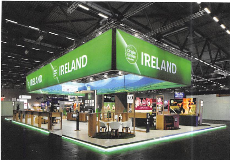
Ein Messestand von BordBia. Die staatliche Agentur setzt sich für die Vermarktung von irischen Lebensmitteln ein.

Mehrere staatliche, irische Agenturen betreuen und fördern den deutsch-irischen Handel. Dazu gehören BordBia in Düsseldorf, mit Fokus auf irische Lebensmittel und Agrarprodukte, und Enterprise Ireland (ebenfalls mit Sitz in Düsseldorf), welches Dienstleistungen und Beratungen für irische Unternehmen in Deutschland anbietet.