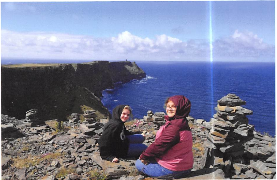
Schülerinnen der Irlandklasse der GWRS Villingendorf zu Besuch bei den Cliffs of Moher

Auch auf schulischer Ebene gibt es viel Begeisterung für den kulturellen Austausch auf beiden Seiten. So gehört die deutsche Sprache zu den beliebtesten Fremdsprachen an irischen Schulen und jedes Jahr finden zahlreiche Klassenfahrten von Deutschland nach Irland statt. Ein Beispiel ist die Irlandklasse der Grund- und Werkrealschule Villingendorf in Baden-Württemberg, die einen eigenen Online-Shop betreibt, um so Geld für die nächste Irlandreise aufzubringen.