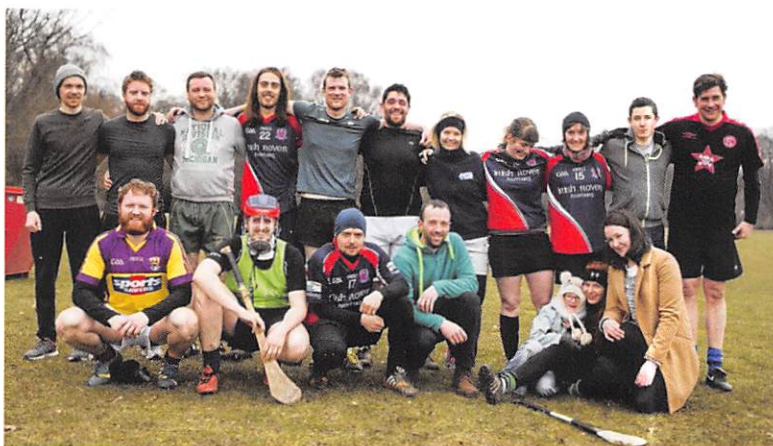
Das Team der Hamburg GAA ist eines von vielen in Deutschland, bei denen ihr mitmachen könnt.

Eine wichtige Rolle spielt auch die irische Sprache. Die Organisation Conradh na Gaeilge ist ein weltweiter Verband, der es sich zum Ziel gesetzt hat, die irische Sprache zu fördern und zu lehren. In Deutschland bietet Conradh na Gaeilge Sprachkurse, Stammtische und viele lehrreiche Veranstaltungen an.