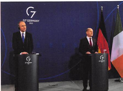
Der irische Taoiseach Martin mit Bundeskanzler Scholz auf einer Pressekonferenz im Februar 2022

Die irisch-deutschen Beziehungen sind enger als je zuvor und das zeigt sich auch in dem Staatsbesuch von Bundespräsident Frank-Walter Steinmeier in Irland im Oktober 2021 sowie die Visite des irischen Taoiseach Micheál Martin in Berlin im Februar 2022.