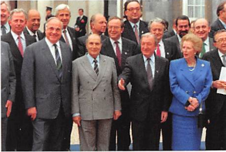
Das EU-Gipfeltreffen in Dublin im Jahr 1990

In den letzten Jahren haben Irland und Deutschland eine erweiterte EU-Zusammenarbeit beschlossen. Dazu gibt es einen gemeinsamen Fahrplan, der 2018 veröffentlicht wurde. Beide Länder möchten eine gemeinsame Klima- und Energiepolitik betreiben und den Austausch zwischen Menschen fördern (z.B. durch ein Projekt zur Förderung von Brieffreundschaften).