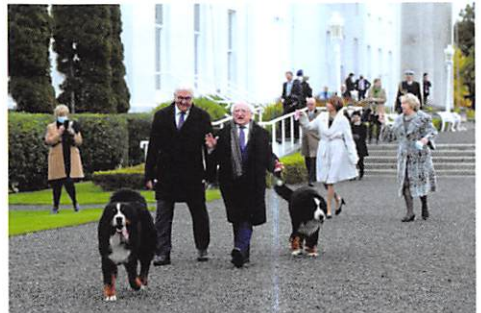
Bundespräsident Steinmeier bei seinem Besuch beim irischen Präsidenten Higgins im Oktober 2021