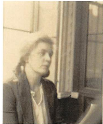
Nancy Wyse-Power – die erste Repräsentantin Irlands in Deutschland

Die modernen Beziehungen zwischen Ländern sind durch die irischen Unabhängigkeitsbestrebungen und die spätere Integration Irlands in die EU geprägt. Bereits im Jahr 1921 entsandte Irland, das zu dem Zeitpunkt noch um seine Unabhängigkeit von Großbritannien kämpfte, eine Vertreterin nach Berlin: Nancy Wyse-Power. Sie legte den Grundstein für die diplomatischen Beziehungen zu Deutschland, die ab 1929 eingeleitet wurden.