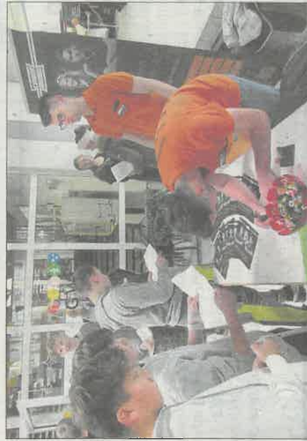
Impressionen von der Berufsmesse des Jahres 2019