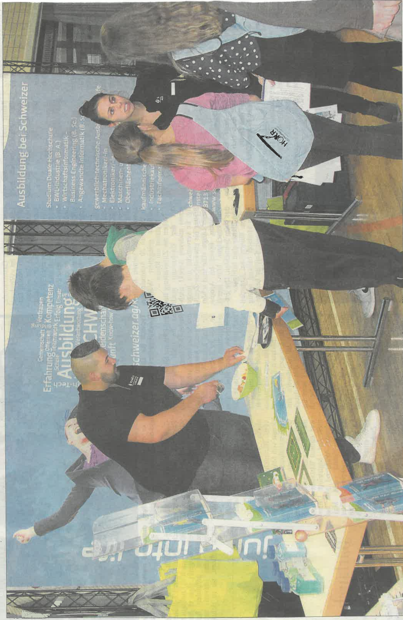
Impressionen von der Berufsmesse des Jahres 2019

Regionales Berufsforum: Mehr als 50 Unternehmen präsentieren sich in Villingendorf