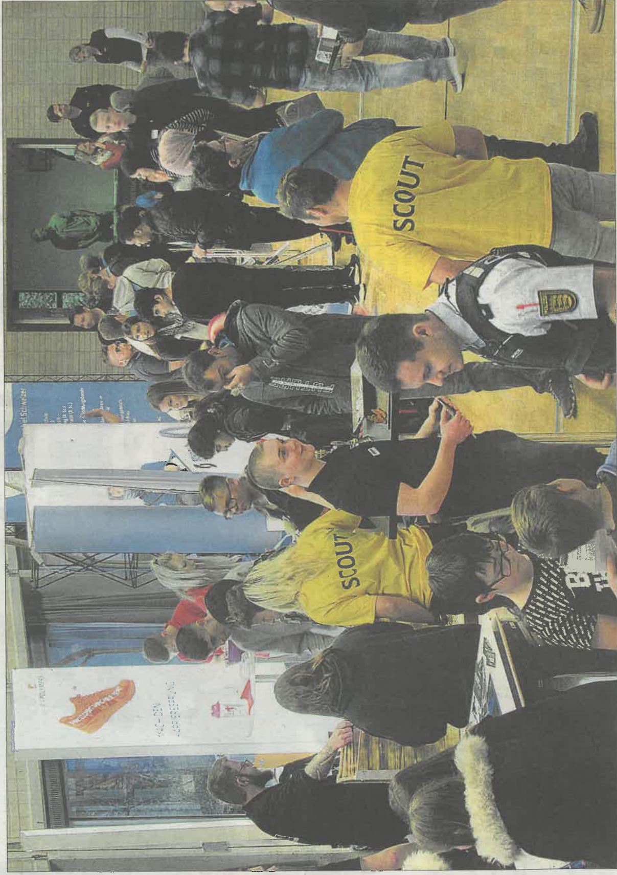
Sämtliche wirtschaftliche Bereiche sind vertreten: Finanzwesen, Gesundheit und Soziales, Handwerk, Industrie, öffentlicher Dienst und Handel.

Wer nach Praktika oder einem Ausbildungsplatz sucht, sollte sich diese Gelegenheit nicht entgehen lassen. Denn alle teilnehmenden Unterneh-